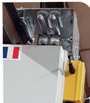
PLOTS DE CHARGE